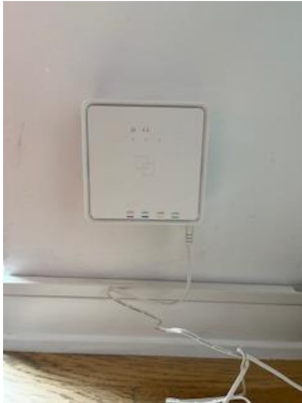
DEN PÅ YDERMUREN